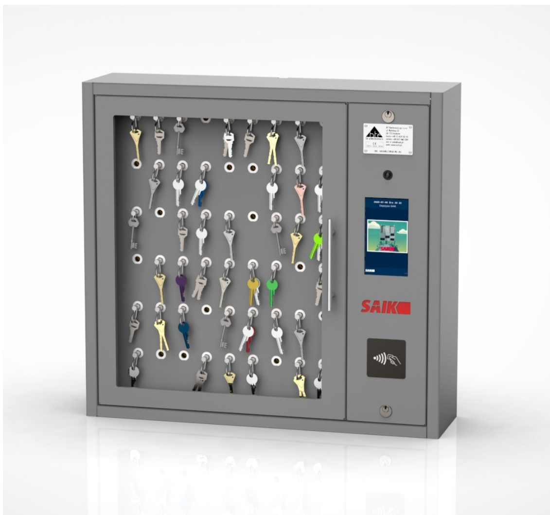
Wizualizacja depozytora SAIK KEY 54